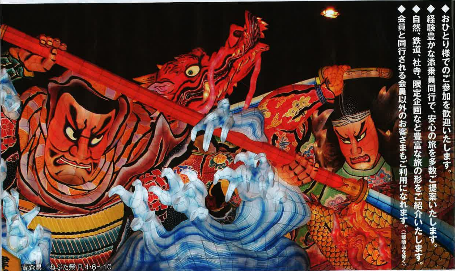
青森県 ねぶた祭 P.4-6~10