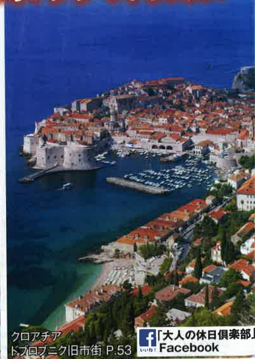
クロアチア トブロブニク旧市街 P.53