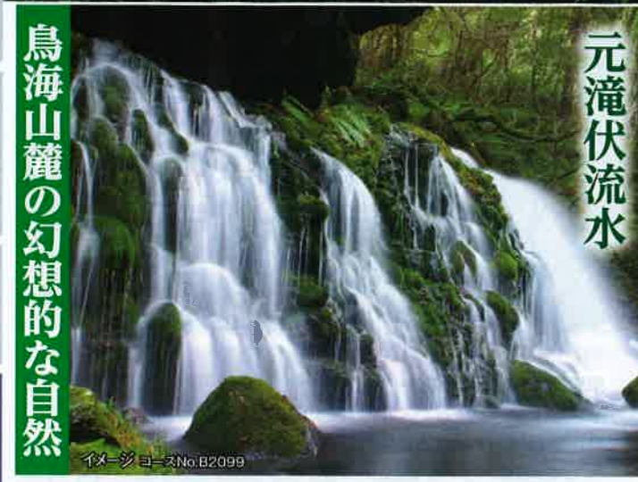
鳥海山麓の幻想的な自然