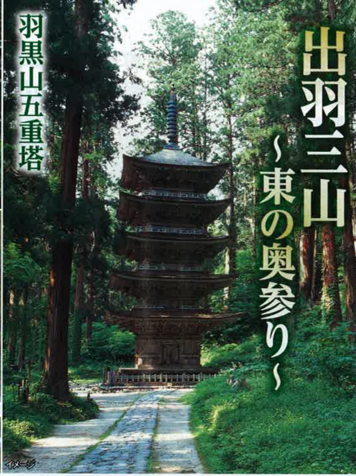
出羽三山 東の奥参り