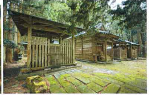
龍門寺 御霊屋(イメージ)