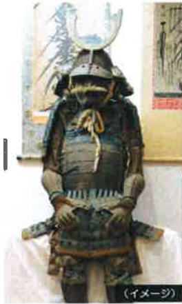
●妙慶寺宝物殿 御田の方が着用した甲冑。兜の鍔形には真田の六文銭の家紋。(イメージ)

真田信繁(幸村)を父とする「直」が藩主正室となり「御田の方」と呼ばれた亀田藩二万石の歴史と史跡を巡る旅