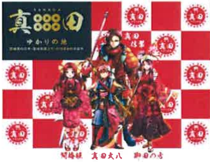
(イメージキャラクター)