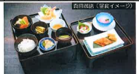
真田御膳 (昼食イメージ) ●季節・仕入状況により食事内容・器等が変更になる場合がございます。

※基本代金は往復普通・快速列車(自由席)のご利用となります。 ※旅行代金は基本代金に各種差額代金を加減した金額となります。