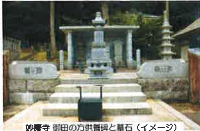
妙慶寺 御田の方供養碑と墓石 (イメージ)

■出発日/平成28年5月12日(木)~9月30日(金) ※2日前までにお申し込みください